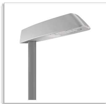
Mini Koffer 2 LED BGP060 road-lighting luminaire