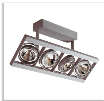
Scrabble QCX500 монтируемый на поверхность многоламповый светильник с галогенными лампами