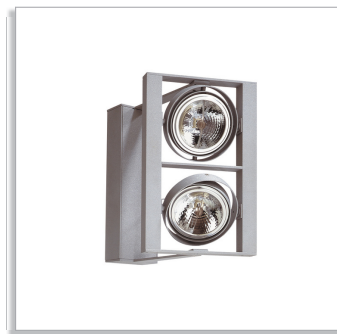
Scrabble QCX500 монтируемый на поверхность многоламповый светильник с галогенными лампами