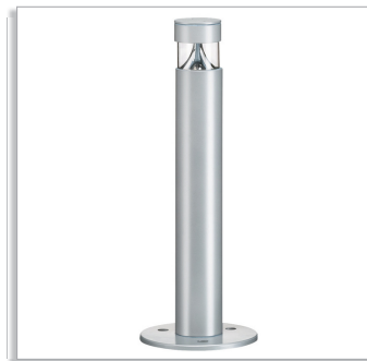
Светодиодный светильник Smart Bollard BSP455, высокий вариант