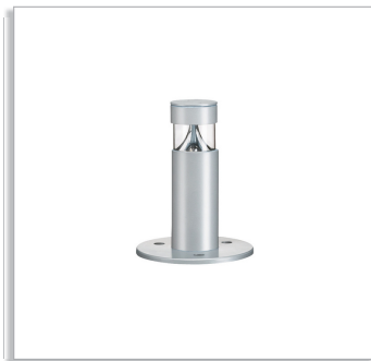
Светодиодный светильник Smart Bollard BSP450, низкий вариант