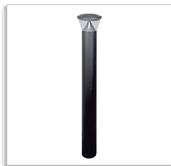
Светильник NightWatch HGP433