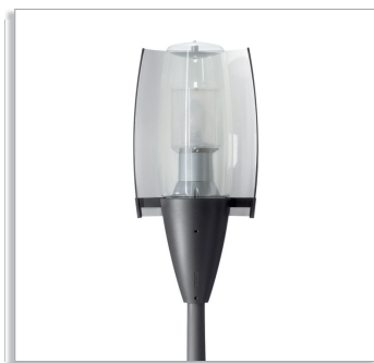
Городской светильник Metronomis Bilbao CDS540 с рассеивателем (DF) и прозрачной чашей (ТВ)