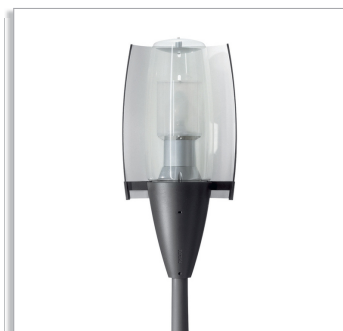
Городской светильник Metronomis Bilbao CDS540 с рассеивателем (DF) и прозрачной чашей (ТВ)