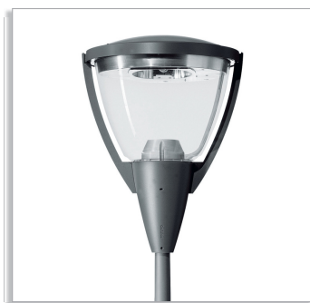
Городской светильник Metronomis Berlin CDS570 с отражателем для дорожного освещения (A), прозрачной чашей и окрашенным колпаком (ТР)