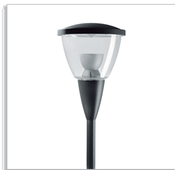
Городской светильник Metronomis Annecy CDS560 с оптикой отраженного света (IO), прозрачной чашей и окрашенным колпаком (ТР)