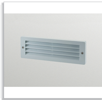
Маркерный светильник EFix Step Marker HWP101