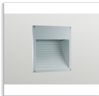
Светильник EFix Step Light HWP200/201