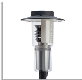
CitySpirit Wall-mounted CWS464 городской светильник с верхним отражателем (Т) и жалюзи для прямого/отраженного света (LO-D/I)