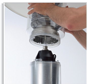
Установка оптического блока