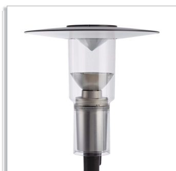
CitySpirit Modern CDS462 городской светильник с симметричным верхним отражателем (TS) и оптикой отраженного света (IO)