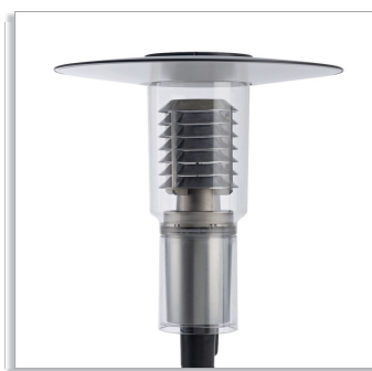
CitySpirit Modern CDS462 городской светильник с верхним отражателем и жалюзи (LO)