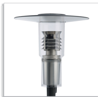
CitySpirit Modern CDS462 городской светильник с верхним отражателем и жалюзи для прямого/отраженного света (LO-D/I)