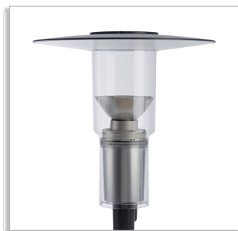
CitySpirit Modern CDS462 городской светильник с верхним отражателем (Т) и оптикой отраженного света (IO)