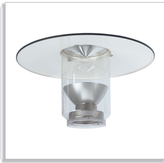
Верхний рефлектор, симметричный (TS) с отражательной оптикой (IO)