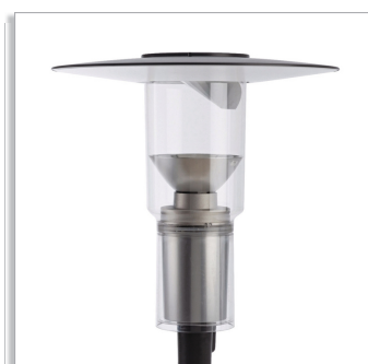
CitySpirit Modern lantern CDS462 urban-lighting luminaire with bi-directional top reflector (TB) and indirect optic (IO)