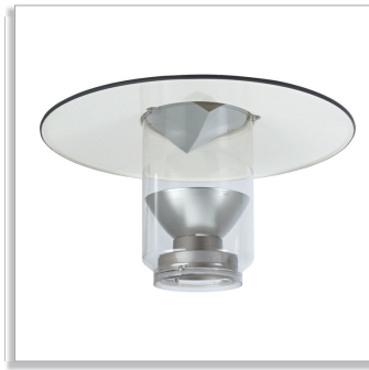
Верхний рефлектор, двунаправленный (TB) с отражательной оптикой (IO)