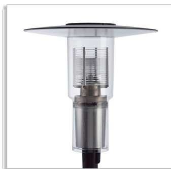
CitySpirit Modern CDS462 городской светильник с верхним отражателем и призматическим рассеивателем (PR)