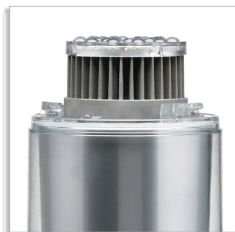
Die-cast aluminum clip