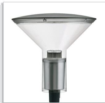
CitySpirit Cone BDS470 urban-lighting luminaire