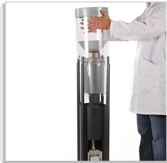
Установка на землю