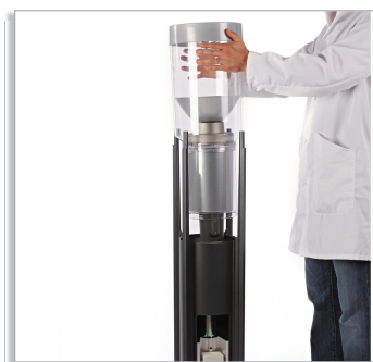
Установка на землю