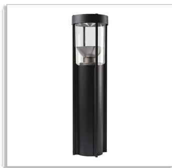
CitySpirit Bollard HGP450/451