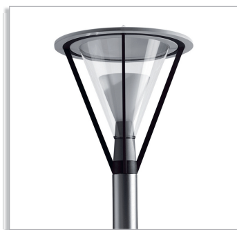
Arken HPS930 городской светильник