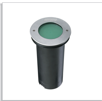
Amazon DBC270/271 архитектурный прожекторный светильник