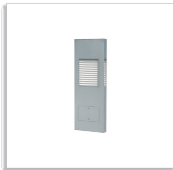
Aether HGP429 светильник в виде световой тумбы