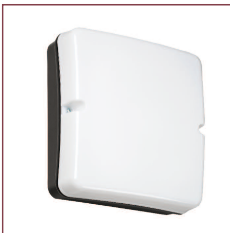
Квадратный матовый светильник