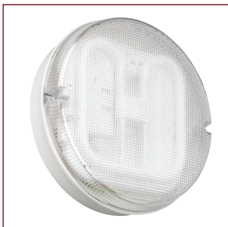
Призматический круглый светильник