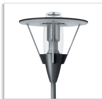
Городской светильник Metronomis Malmö CDS550 с призматическим рассеивателем (PR) и прозрачной чашей (ТВ)