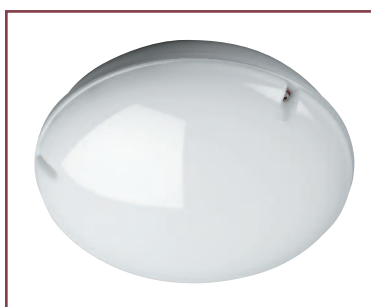
DRG без защитной решетки и защитного корпуса