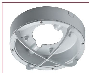
Защитный корпус имеет скрытые крепления для монтажа