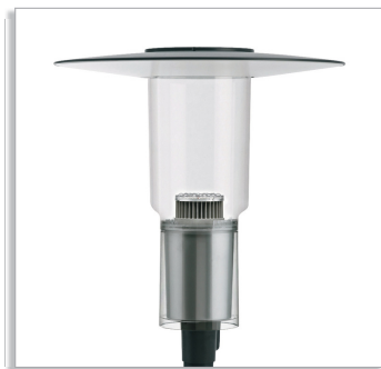
CitySpirit Modern lantern BDS462 urban-lighting luminaire