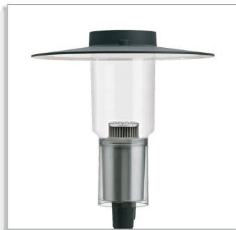
CitySpirit Classic lantern BDS460 urban-lighting luminaire