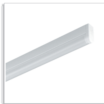
Medison TCS054 реечный светильник с опаловым рассеивателем (O)